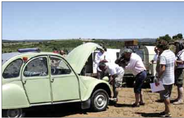
Arriba, el equipo de Cine de Barrio durante el rodaje en Zamora.