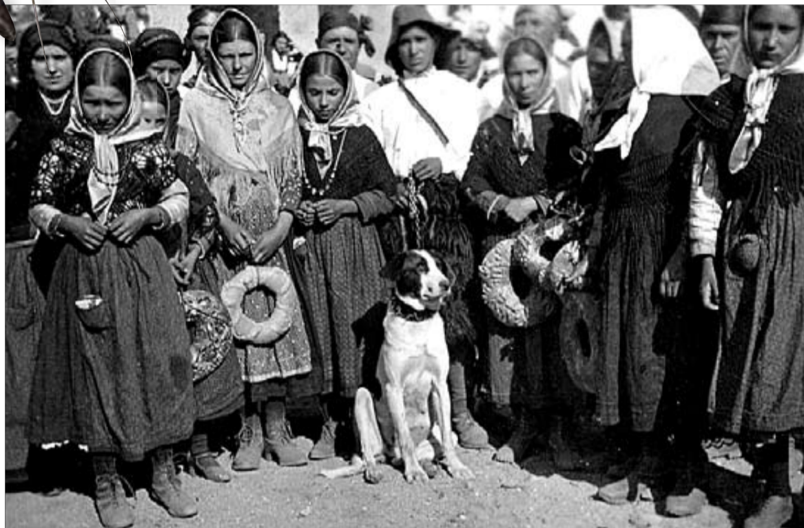
En la imagen, una de las fotografías que pueden verse en la exposición.