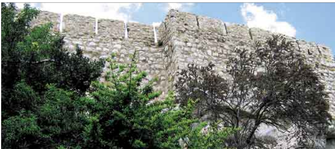
Sobre estas líneas, una imagen del tramo de la muralla en el que se actuará en los próximos meses.