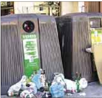
Los contenedores de basura y las calles se quedarán sin limpiar.

Toda la programación semanal de TeleVisión