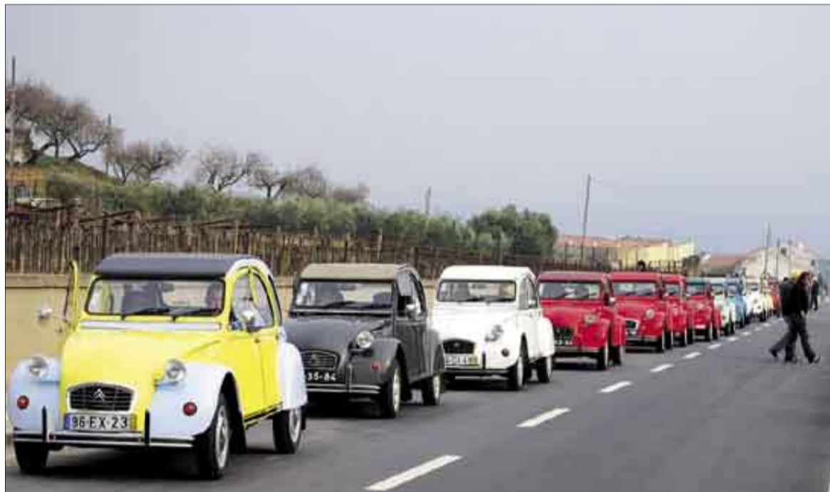
Una caravana de coches 2CV en las carreteras portuguesas.

Surgió esta asociación de una delegación en Braga del Club 2 CV/Dyane de Portugal, con sede en Lisboa (Alfama) y que es el club nacional mas antiguo dedicado a un modelo de coche (29 de Abril de 1982) y con mas socios (cerca de 2.400). Esta delegación, que existió durante dos años (5 de Abril de 2003 al 9 de Mayo de 2005), propuso decenas de nuevos socios para el club nacional y dos decenas de nuevos socios para el club nacional y creó el movimiento asociativo que dio origen al nuevo club. Por diversas razones, terminó esta delegación por convertirse en club autónomo, la "Bicavalarido Minho"? Clube 2 CV y similares que aprobó sus estatutos, en Asamblea General, el 13 de Mayo de 2005 (después de dos reuniones preparatorias divulgadas por la prensa regional Diário del Miño y Correo del Miño), hizo escritura pública el 22 de Junio y eligió sus órganos sociales el 29 del mismo mes. Escogió, también en Asamblea General, el 13 de Julio su logótipo, registro el