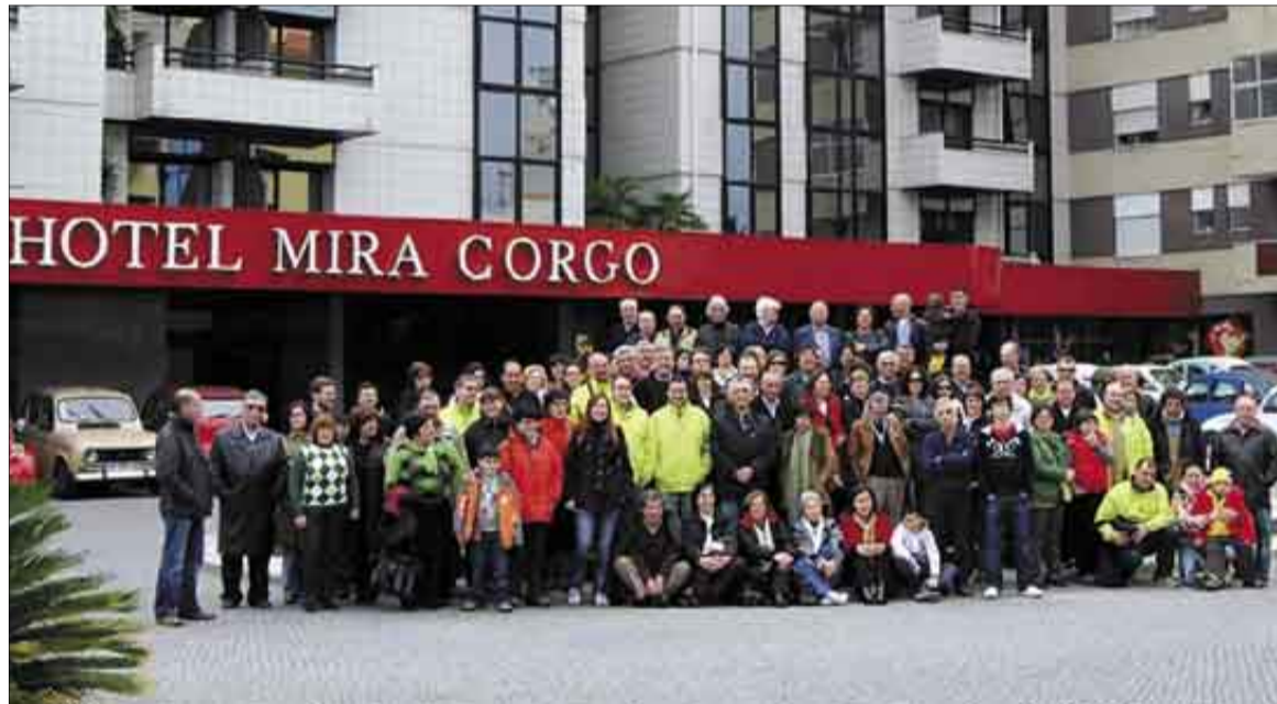
Foto de família dos participantes na concentração do passado fim-de-semana .

em 14 de Julho e aprovou o seu Regulamento Interno em 10 de Outubro do mesmo ano.