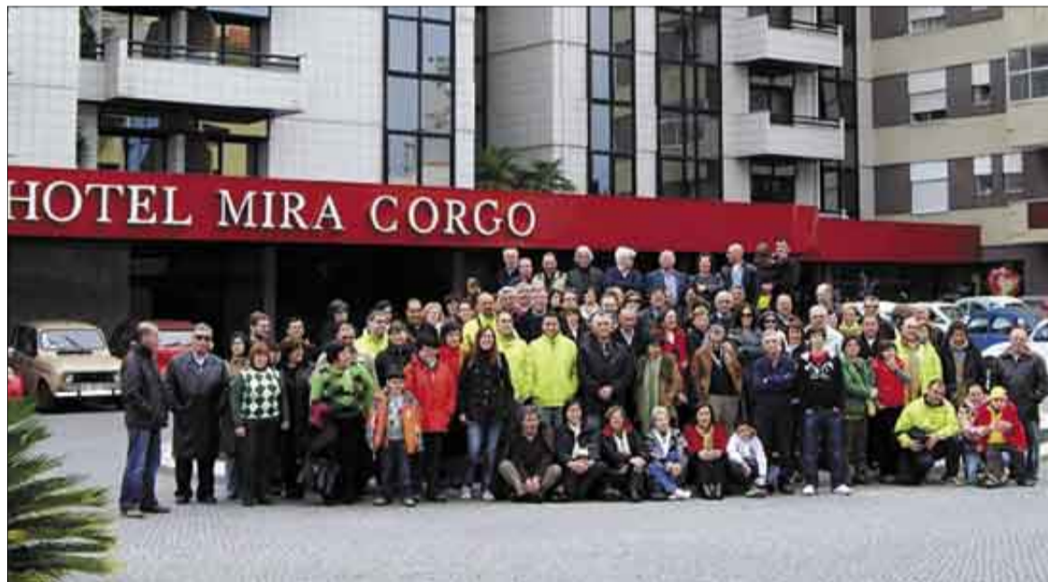
Foto de familia de los participantes en la concentración del pasado fin de semana.

inicio de su actividad en la Hacienda en Braga el 14 de Julio y aprobó su Reglamento Interno el 10 de Octubre del mismo año.