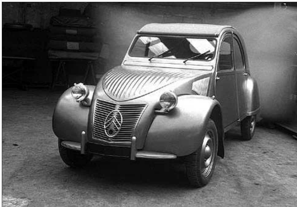
El primer modelo de 1948 tenía un motor con 9 caballos de potencia.