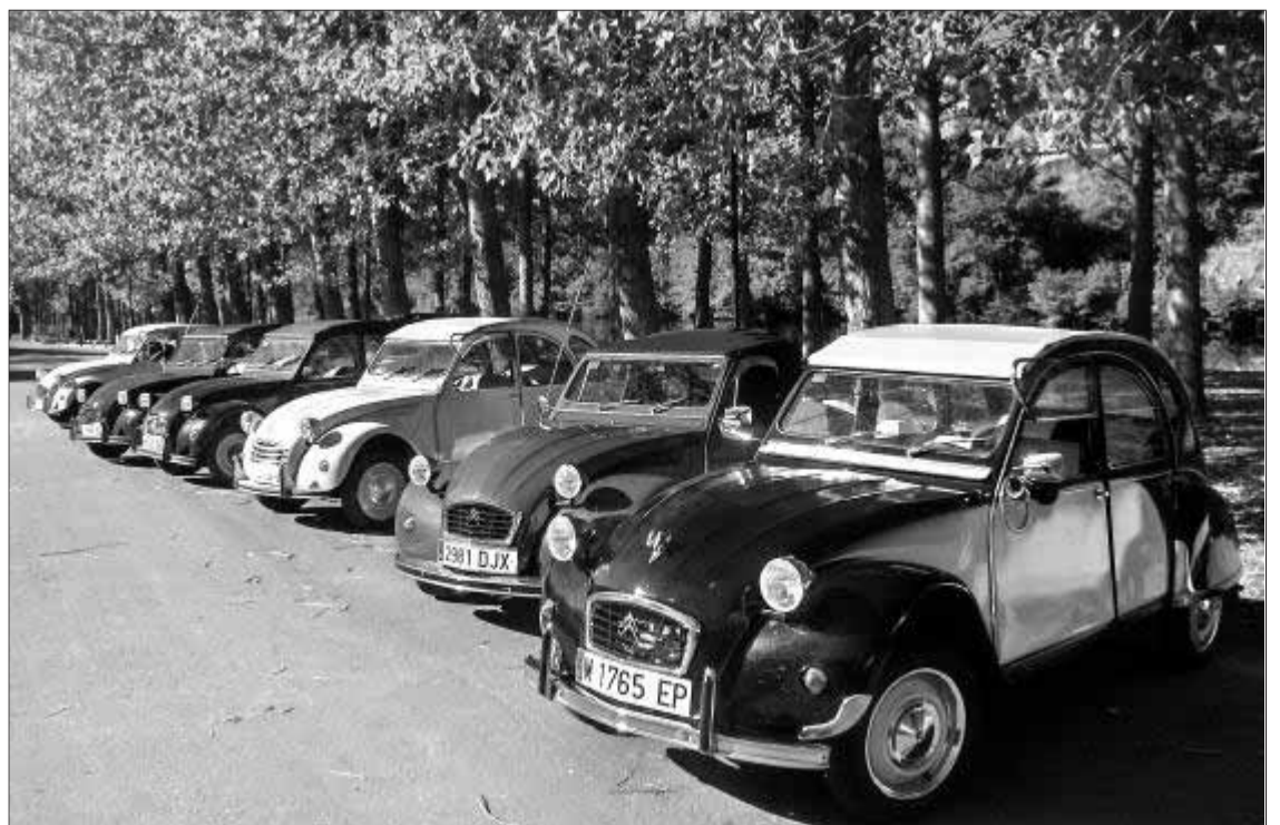
Varios automóviles expuestos en la capital durante la concentración celebrada en las Ferias y Fiestas de San Pedro

Los editores del programa de televisión nacional grabaron toda la concentración de coches y emitirán en torno a cuatro minutos sobre el evento en la capital zamorana.